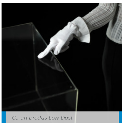
Cu un produs Low Dust