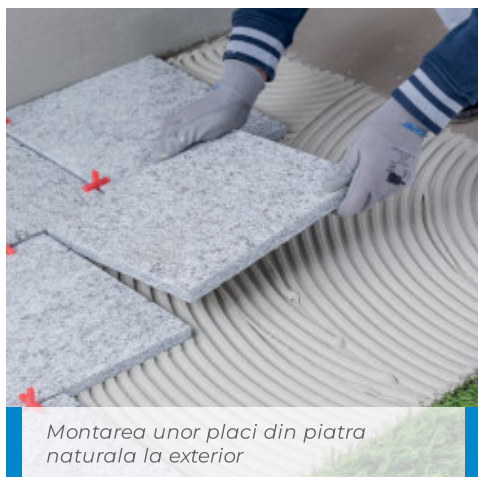
Montarea unor placi din piatra naturala la exterior

In cazul lipirii in puncte de aderență a placilor fonoabsorbante sau izolante, Keraflex Maxi S1 va fi aplicat cu o mistrie sau spatula, grosimea de aplicare fiind in functie de planeitatea suportului, iar numarul de puncte de adeziv va fi in functie de greutatea panourilor.