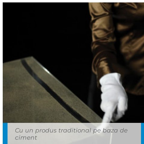
Cu un produs traditional pe baza de ciment