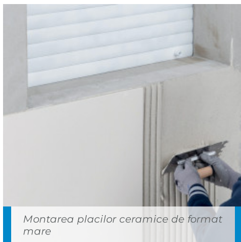
Montarea placilor ceramice de format mare